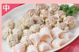
点心盛合せ (焼売、海老餃子、餅米団子)