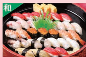
握り寿司 ※夏期は販売中止