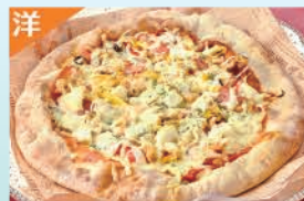
手作りミックスピザ