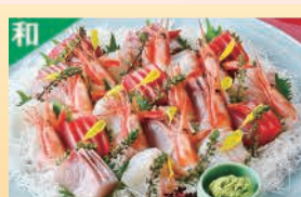
お造り盛合せ ※夏期は販売中止