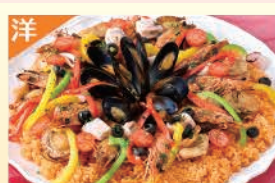
シーフードバリエーション