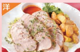
塩豚の香草焼きロースト