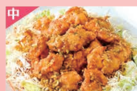
鶏の薬味ソース掛け