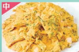
チャイニーズ海鮮チヂミ