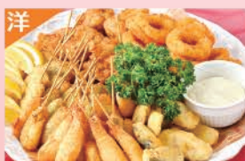
揚げ物バラエティ盛合せ