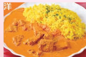
バターチキンカレー&ライス