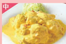
海老のマンゴソース和え