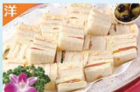
ミックスサンドイッチ