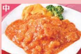
海老のチリソースとフワフワ卵炒め