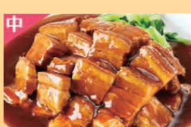
上州せせらぎボークの角煮