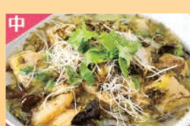
長崎産鯛の高菜ソース掛け