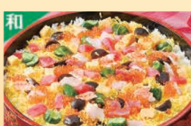
海鮮(ラちらし)寿司 ※夏期は販売中止