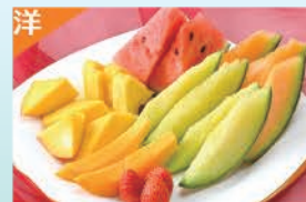
季節のフルーツ盛合せ