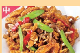
牛フィレの黒胡椒炒め