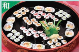
巻物盛合せ ※夏期は販売中止