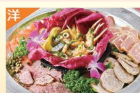
オードブルバリエーション