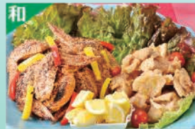
手羽先と鶏の竜田揚げ