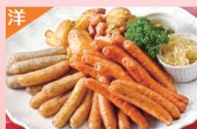
ソーセージ&ジャーマンポテト