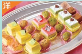
アルカディア特製デザート盛合せ