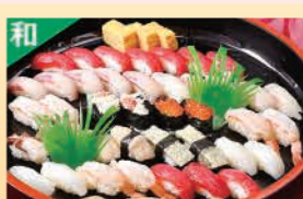
握り寿司 (上) ※夏期は販売中止