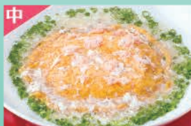
蟹と卵の炒め 淡雪ソース掛け