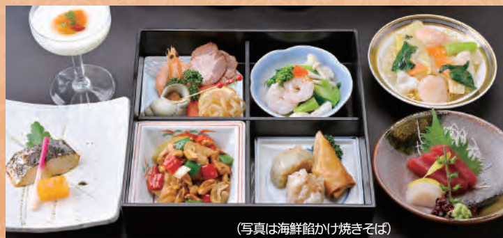
(写真は海鮮餃かけ焼きそば)