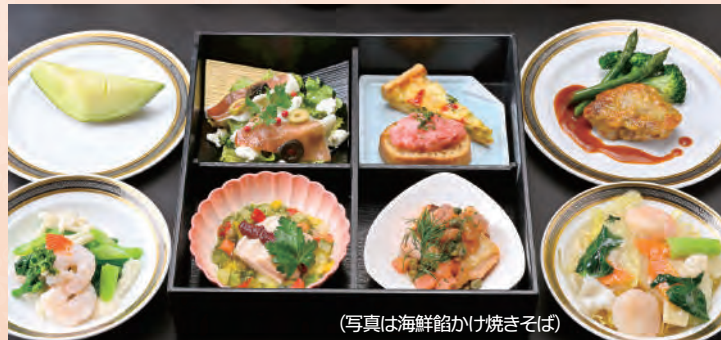
(写真は海鮮餃かけ焼きそば)