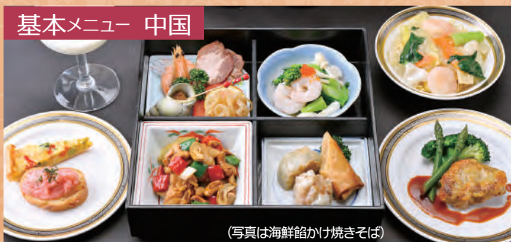
(写真は海鮮餃かけ焼きそば)